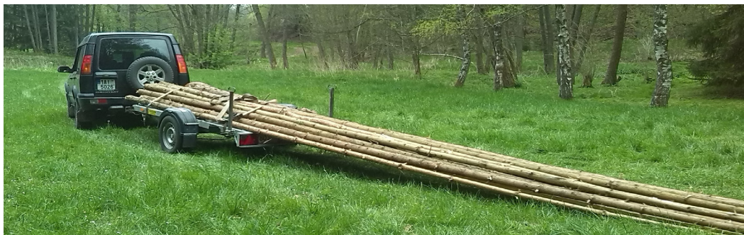
Brigáda v Sedle: Žvejka stěhuje tee-pee tyče po indiánsku

STAVBA TÁBOŘIŠTĚ V SEDLE SKAUTSKÉ TÁBORY V SEDLE ROVERSKÝ TÁBOR RK MEDOJEDI BOURÁNÍ TÁBOŘIŠTĚ V SEDLE