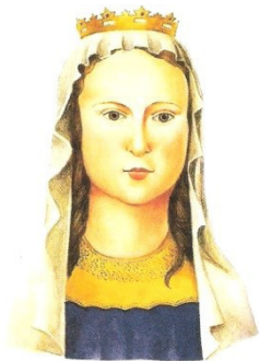
Viola Těšínská česká a polská královna od 5. 10. 1305 do 4. 8. 1306