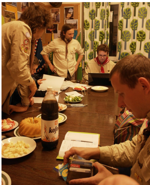
Napoleon předává otěže střediska Mudrcovi

Když odhlédnu od toho, že se velmi změnila i společnost jako taková, třeba „internetová revoluce“ byla v plenkách, když jsem začínal, tak se skauting za dobu, co jsem skautským vedoucím, změnil velmi. Teď budu vypadat trochu jako stará páka, ale od mých vůdcovských počátků v roce 97 se proměnilo skoro všechno – od stylu vedení a řízení oddílů a středisek přes obsah programu až po náhled veřejnosti na skauty. Věci, postupy a materiál, které dneska nastupující vedoucí berou jako samozřejmé, tu nebyly vždycky. Každá doba má něco, oni mají spoustu možností a příležitostí, naše generace zase měla velkou příležitost radikálně věci měnit a vymezovat se vůči starším generacím, což se nám, přiznejme si to upřímně, taky dost líbilo.