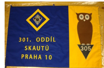
Vlajka v pořadí č. 3 (305) a č. 5 Sovího oddílu (druhá renovovaná 301)