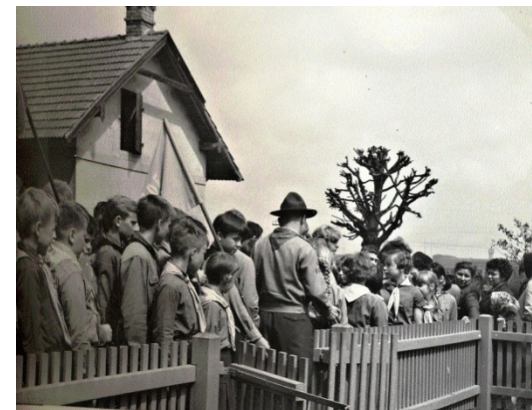
Prozatímní obnovovací vlajka 305 na výletě v Lánech u hrobu T.G.M 19. 5. 1968.