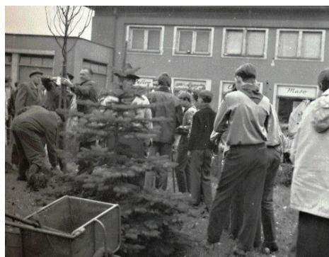
Prozatímní obnovovací vlajka 305 na akci při sázení stromu republiky – lípy, v Mukařovské ulici 28. 10. 1968.