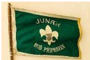
1. vlajka Sovího oddílu 305. Přejato z Atriho brožurky „75 let skautské Pětatřicítky“.

V polovině listopadu 1947 zadal Atri speciální vyšivačské firmě v Karmelitské ulici výrobu této vlajky 305. oddílu – Sovího oddílu. Bylo usnesením oddílové rady, že na ni bude znak Prahy. „Těšili se na leden 1948, že vlajka bude hotova“. Psal se 8. květen 1948. Bylo slavnostní otevření klubovny - s předáním první vlajky 305. oddílu. V kronice Třístapětky se píše: «S obdivem jsme dnes poprvé shlédli oddílovou vlajku, která se tyčila vedle vlajky státní a střediskové. Vlajky nesli vzorní junáci. Večer byl táborák se slibem vlčat a skautů. Drobně krápal.» Po této krásné slavnosti byla nuceně ustavující schůze 5. skupiny SČM... Tlak komunistů, kteří se dostali k moci, sílil. 17. listopadu 1948 nám zapečetili naši klubovnu a celý Junácký domov J. Luxy na Libeňském ostrově. 305. skautský oddíl - Soví 1947 – (1968 kde zůstala ukryta první vlajka? Neobjevila se). Objevila se z úkrytu až v listopadu 1989 při další obnově Junáka - viz článek „O oddílové vlajce“ od Napa v Lokali 4/2016 35. střediska).