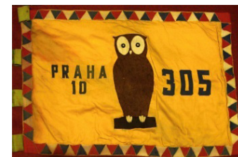
Vlajka v pořadí č. 3 (305) a č. 5 Sovího oddílu (druhá renovovaná 301)

Tato, již historická, vlajka č. 3, vznikla zásluhou sestry Jarky Kofroňové - Pákové, která nám ji zkompletovala a ušila ve skauty nadšeném roce 1968. Byl to úžasný rok - rok obnovy Junáka náčelníkem Rudolfem Plajnerem - Tátou. Pro nás skauty i nováčky, pro nás pamětníky – OS staré pažby, jen vzpomenutí na něj nás posiluje, že byl vymrštěn tenkrát skautský šíp, který překonal totalitu a zapíchl se jako výzva v Sametové revoluci k nohám skautů nové obnovy Junáka v roce 1990.